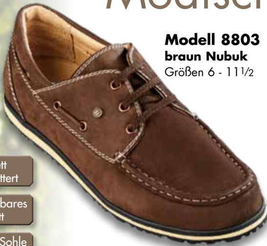
Modell 8803 braun Nubuk Größen 6 - 11 1/2