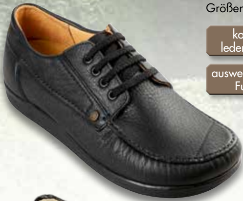
Modell 1158 schwarz Größen 4 - 11 1/2