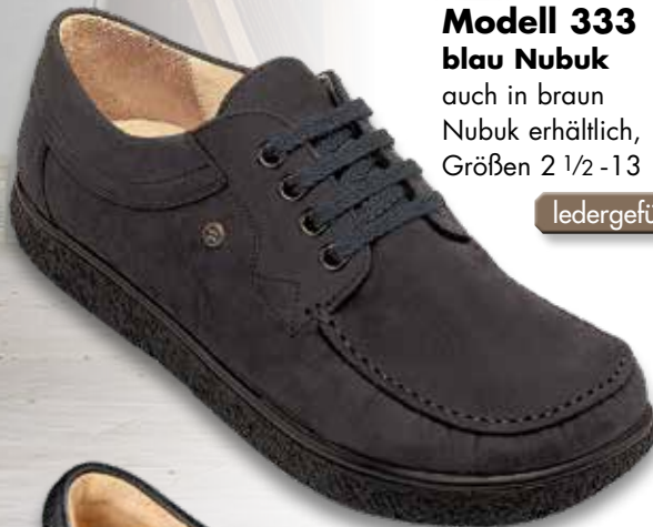
Modell 333 blau Nubuk auch in braun Nubuk erhältlich, Größen 2 1/2 - 13