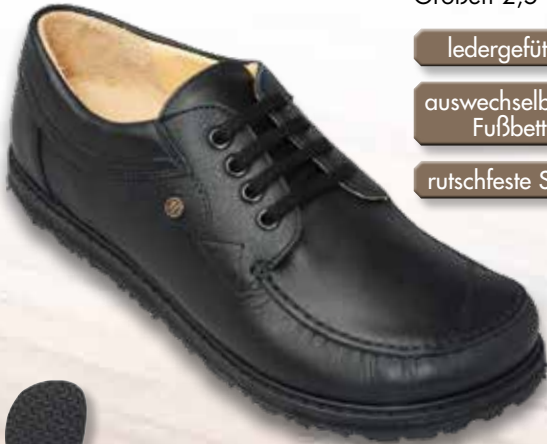
Modell 136 schwarz Größen 2,5 - 11 1/2