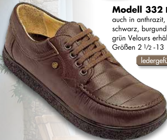
Modell 332 braun auch in anthrazit, weiss, schwarz, burgund und grün Velours erhältlich, Größen 2 1/2 - 13

Dies gilt, bis auf den heutigen Tag - denn an der Qualität und an dem Produktionsverfahren unserer JACOFORM-Schuhe haben wir nichts verändert. Alle JACOFORM-Schuhe werden nach den selben Prinzipien und mit einem hohen Anteil an handwerklicher Qualitätsarbeit gefertigt. Und das Obermaterial aller unserer Schuhe ist natürlich aus echtem Leder.