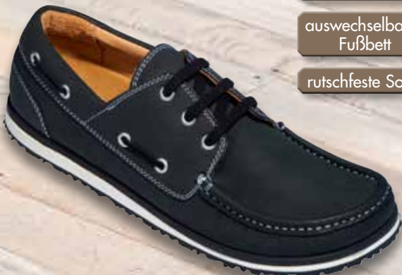
Modell 184 schwarz Nubuk Größen 4,5 - 11,5