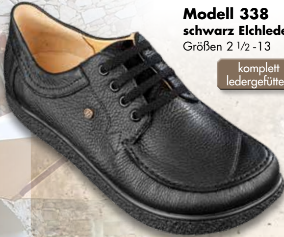
Modell 338 schwarz Elchleder Größen 2 1/2 - 13