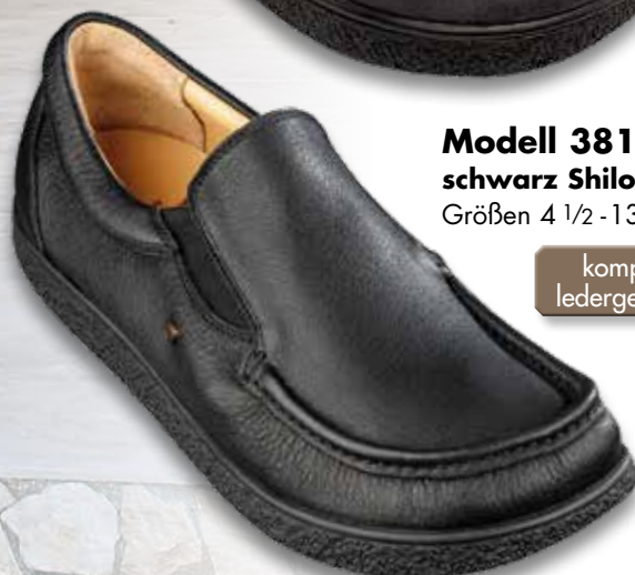
Modell 381 schwarz Shiloh Größen 4 1/2 - 13

auch in schwarz, burgund, braun und blau-weiss erhältlich, Größen 2 1/2 - 15