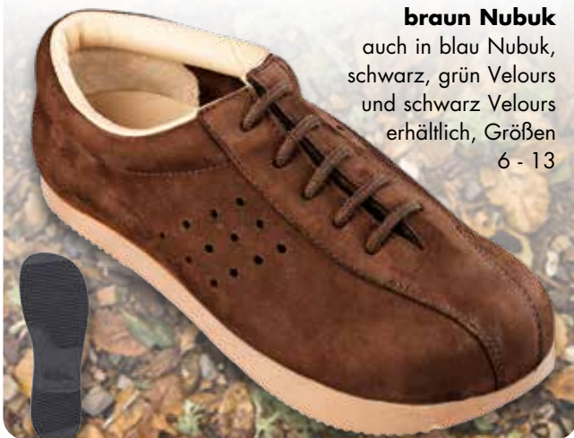
Modell 10 braun Nubuk auch in blau Nubuk, schwarz, grün Velours und schwarz Velours erhältlich, Größen 6 - 13