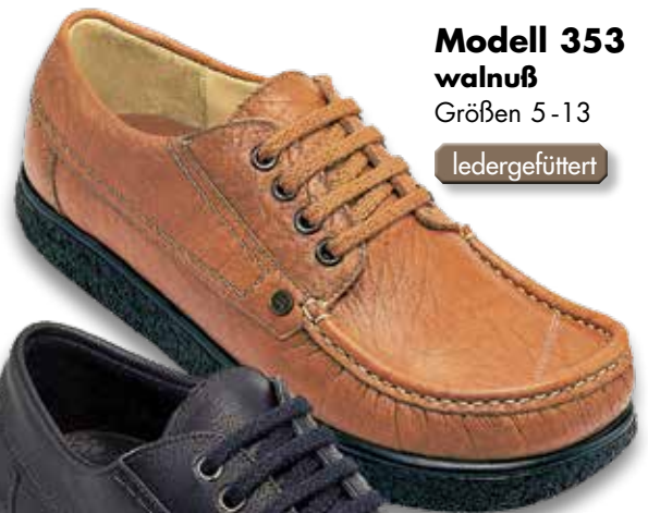
Modell 353 walnuß Größen 5 - 13