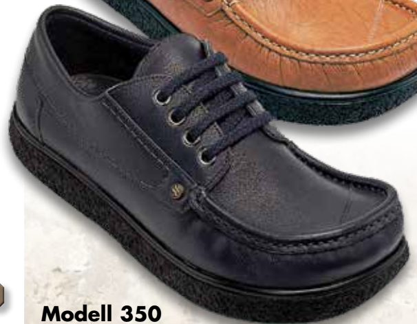
Modell 350 blau

auch in schwarz, burgund, braun und blau-weiss erhältlich, Größen 2 1/2 - 15