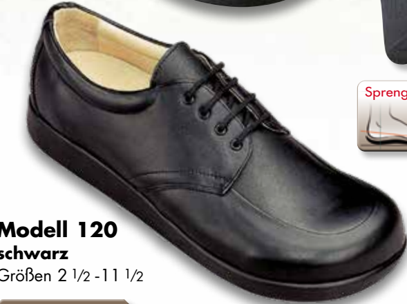
Modell 120 schwarz Größen 2 1/2 - 11 1/2