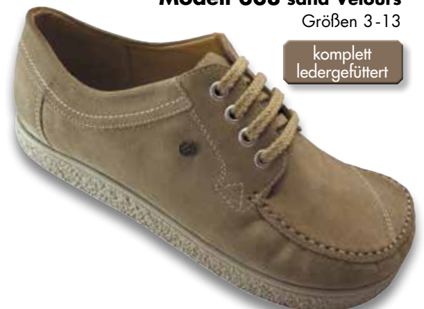
Modell 338 sand Velours Größen 3 - 13