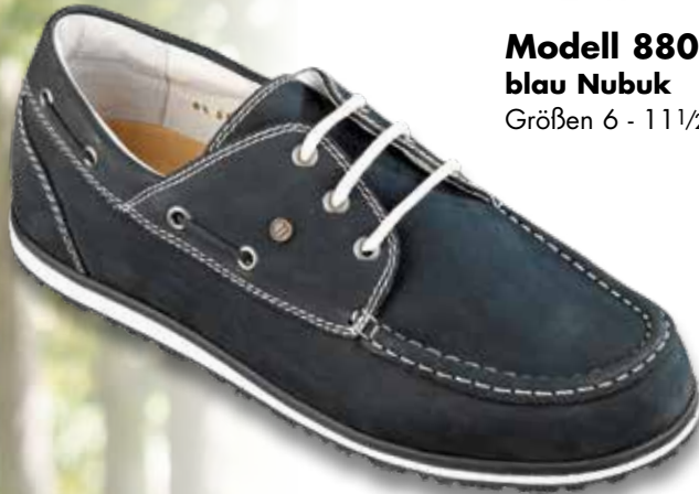
Modell 8803 blau Nubuk Größen 6 - 11 1/2